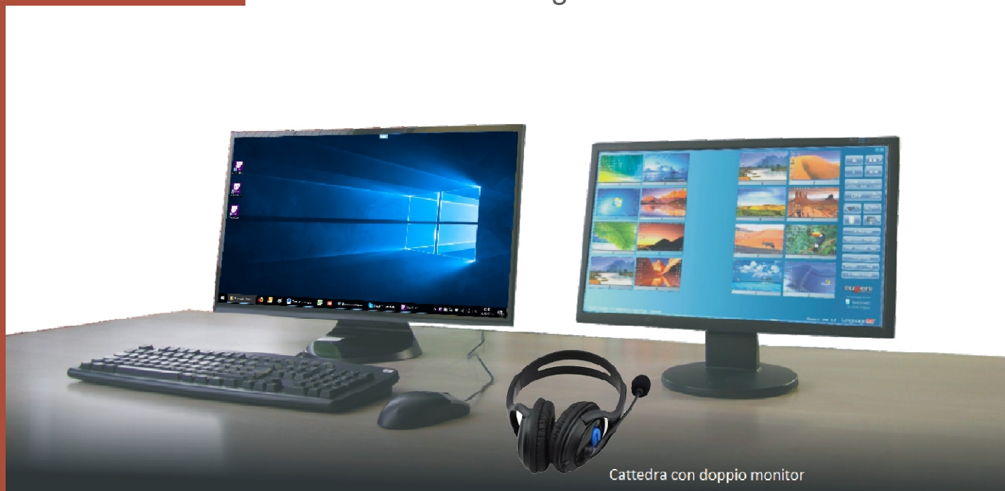
Cattedra con doppio monitor